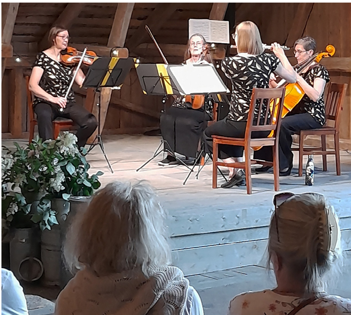
Konsertti Nyynäisten Wintillä, Lemu

Muistathan myös ottaa käyttöön Varsinais-Suomen sosiaali- ja terveydenhuollon järjestämissuunnitelman yhteistyöryhmän järjestöprojektiryhmän ja JärjestöSotehanke 113, Varsinais-Suomen luoman Järjestöystävällinen kunta -toimintamallin. Löydät sen esimerkiksi Innokylän verkkosivuilta .