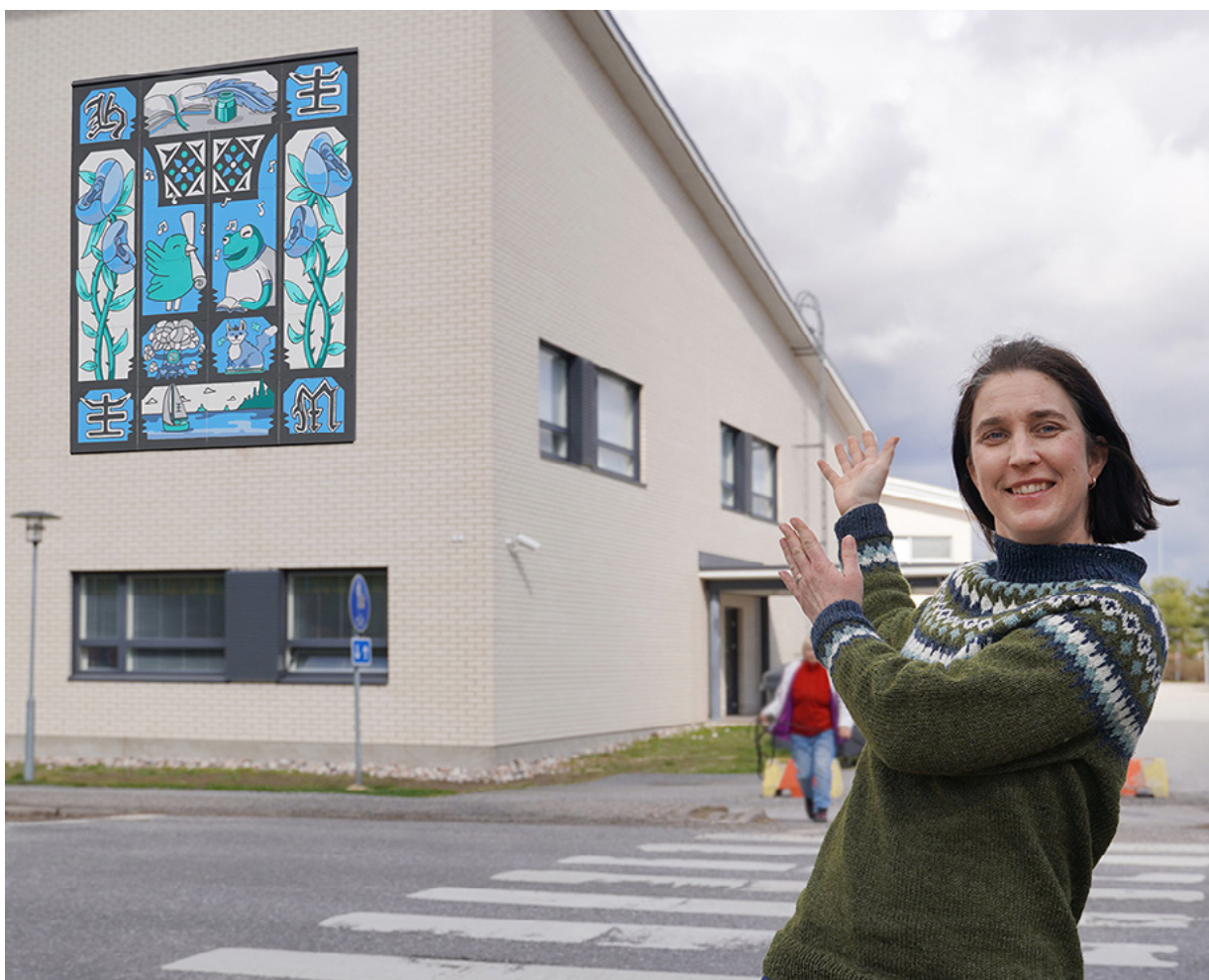
Maskun Hemminki -hanke