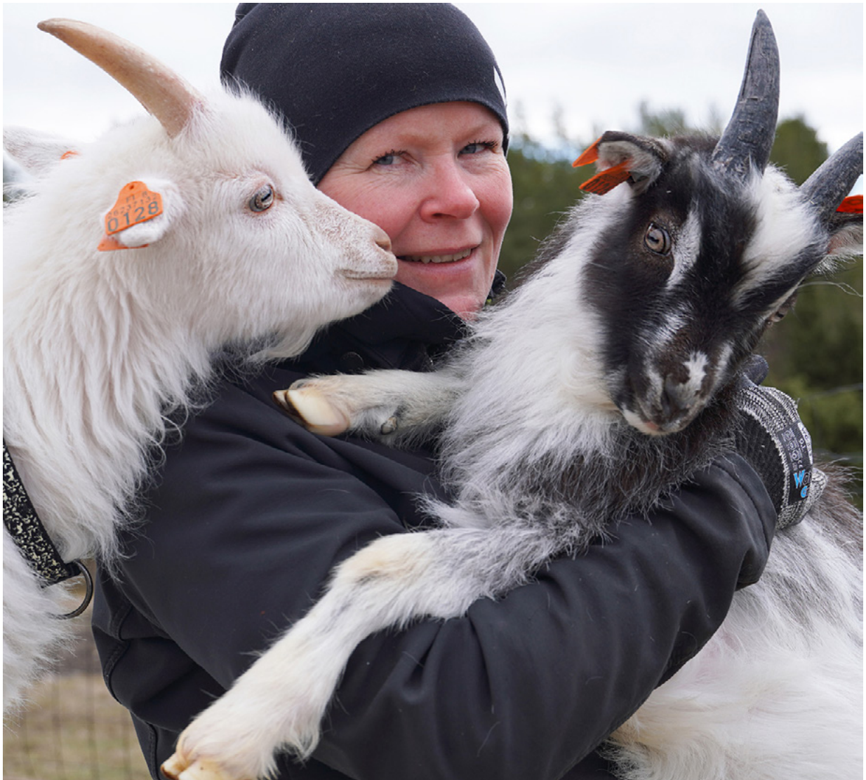
JUMO3 | Haloo Maaseutu | Flickr