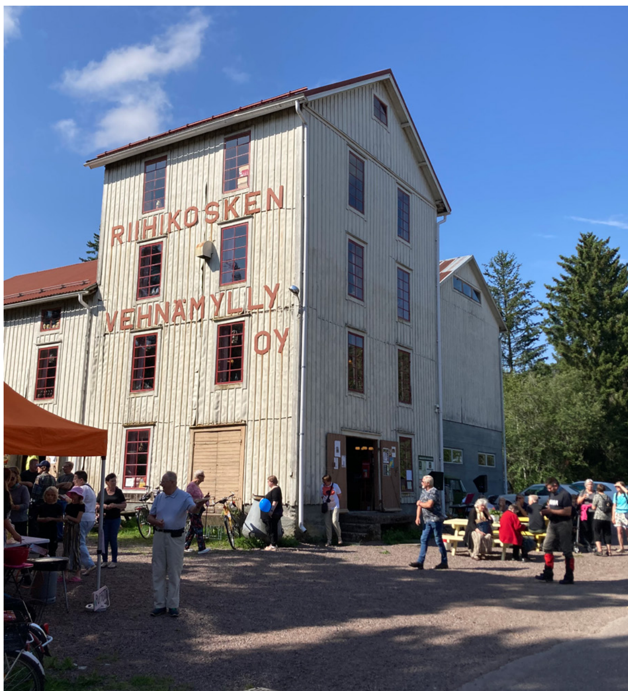
Kesätapahtuma Pöytyän Riihikosken vanhalla vehnämyllyllä

Järjestön oman toiminnan muutokset – tai muuttumattomuus – ovat tietysti tapauskohtaista. Onko yhdistyksessä pohdittu, miksi se on aikanaan perustettu ja miksi se on olemassa? Mennäänkö aate vai arki edellä? Ollaanko valmiita kokeiluihin? Onko yhdistyksessä osattu delegoida tehtäviä vai kasaantuvatko ne harvoille? Onko jaksamiseen panostettu? Onko yhdistyksellä strategiaa tulevaisuuteen: uskalletaanko päästää irti vanhasta ja asettaa uusia tavoitteita uudessa toimintaympäristössä? Osataanko toisaalta karsia turhat toiminnot?