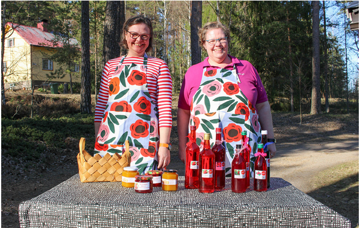
Touhitun kylä