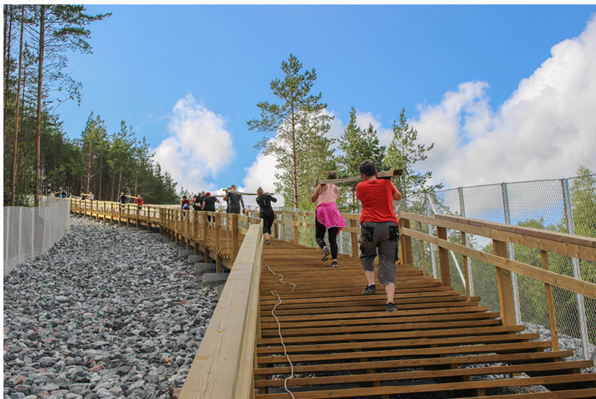
Paraisten kuntoportaat

Kuntien hyvinvointisuunnitelmien laadinnassa, samoin kuin esimerkiksi kulttuurihyvinvointisuunnitelmien koostamisessa, tulee kuulla myös 3. sektoria. Hyvinvoinnin edistämistä on myös varautuminen ilmastonmuutoksen ympäristö- ja terveysvaikutuksiin.